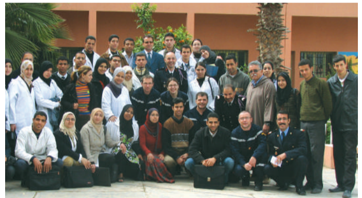
Nous avons participé à la journée mondiale des Sapeurs Pompiers à Marrakech et échangé nos méthodes de travail.