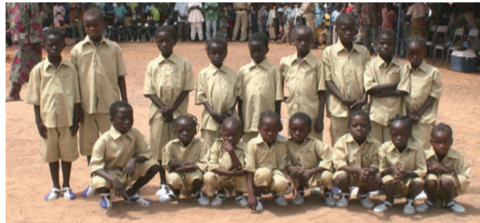
17 des 25 enfants parrainés par le CoJYV en 2009