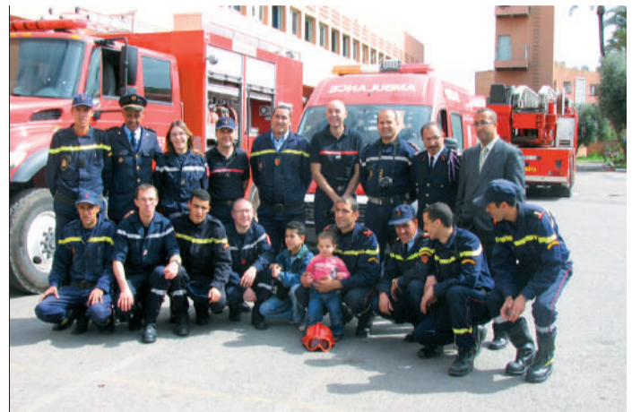
Les Sapeurs Pompiers de Vouillé ont profité de cette occasion pour former aux gestes de premiers secours des jeunes instituteurs qui officient dans des classes de campagne isolées.